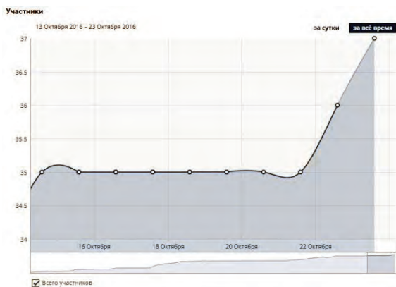
Рис. 1. Анализ числа участников группы БУ «Комплексный центр социального обслуживания населения «Родник» в социальной сети «ВКонтакте»