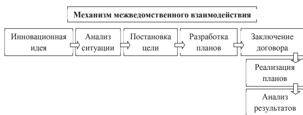
Рис. 1. Механизм межведомственного взаимодействия

Заключены соглашения и реализуются совместные планы с 23 учреждениями города, разработан механизм межведомственного взаимодействия, позволивший обеспечить системность, комплексность, непрерывность, последовательность предоставления социальных услуг различными ведомствами и осуществлять непрерывное согласованное межведомственное сопровождение детей-инвалидов, детей с ограниченными возможностями учреждениями социальной сферы (здравоохранение – социальная защита – образование – культура и др.) (рис. 1).