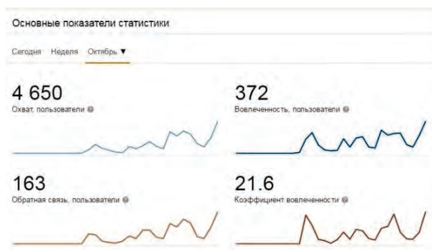
Рис. 4. Анализ числа участников группы «Волонтер-онлайн – «Родник» – источник доброты» в социальной сети «Одноклассники»

числа населения города. Так, за 6 месяцев работы социальных групп в социальной сети «ВКонтакте», «Одноклассники» привлечено 22 гражданина, которые безвозмездно передали нуждающимся гражданам из числа состоящих на социальном обслуживании в Учреждении вещи (мебель, мягкий инвентарь, игрушки и др.). Охвачено одиннадцать семей, пять одиноко проживающих пожилых граждан, три гражданина с ограниченными возможностями здоровья.