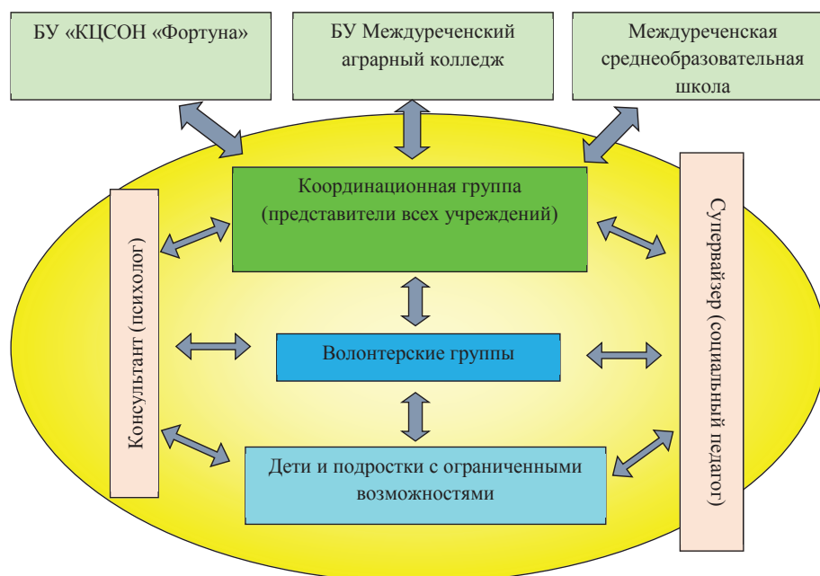
Рис. 1. Схема взаимодействия при организации волонтерской деятельности

Вводный курс облегчает волонтерам понимание того, как он может применить себя, свои навыки и компетенции в учреждении, а также помогает усвоить правила, технологии работы и предписания, существующие в организации.