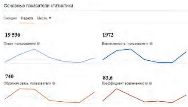
Рис. 2. Анализ числа участников группы БУ «Комплексный центр социального обслуживания населения «Родник» в социальной сети «Одноклассники»