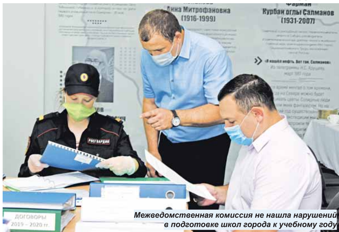
Межведомственная комиссия не нашла нарушений в подготовке школ города к учебному году

С 3 по 6 августа планируется проверить готовность 37 школ и садилов города, в которых за лето был выполнен ремонт на общую сумму 33 млн рублей.