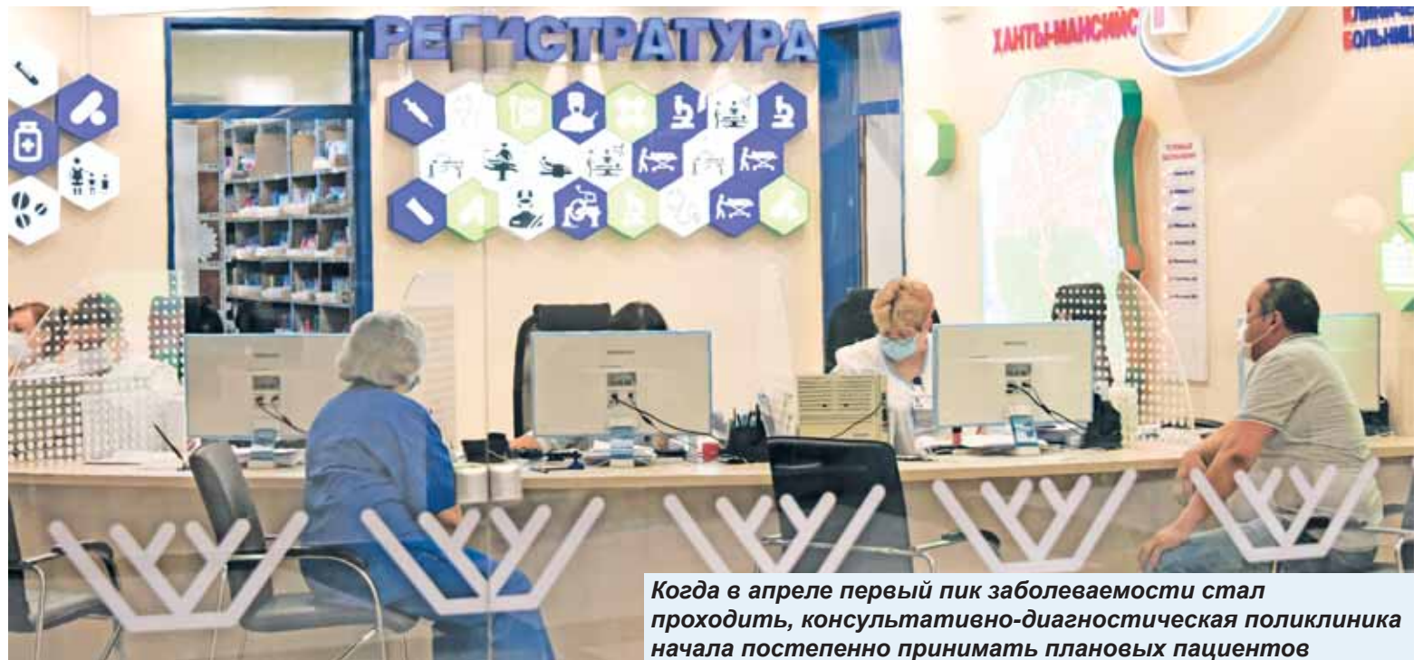
Когда в апреле первый пик заболеваемости стал проходить, консультативно-диагностическая поликлиника начала постепенно принимать плановых пациентов

– Поскольку в Ханты-Мансийске нет отдельной городской поликлиники, наша консультативно-диагностическая поликлиника оказывает горожанам первичную медико-санитарную и первично-специализированную помощь. Помимо этого, есть узкие специалисты, помогающие участковым терапевтам работать как с жителями города, так и с теми, кто проживает в Ханты-Мансийском