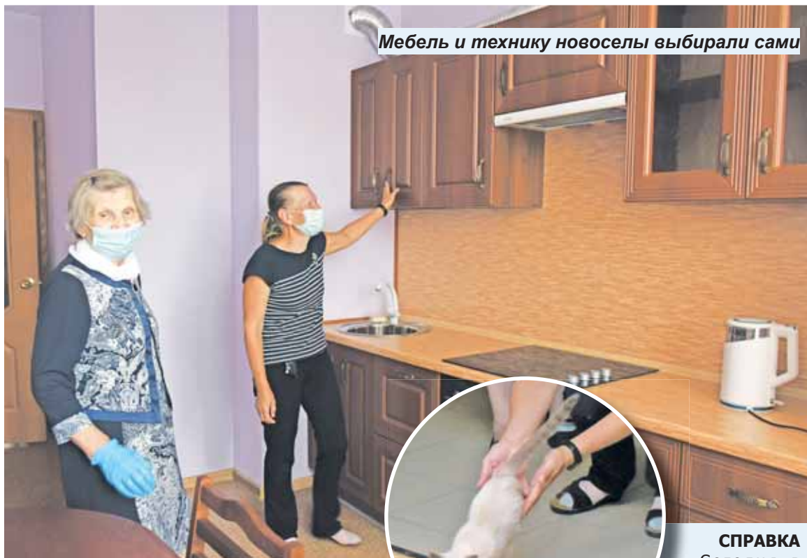
Мебель и технику новоселы выбрали сами

Сестры родом из Белоруссии, и их детство выпало на войну. В 1941 году отца забрали на фронт. А в 1942 году село Буда-Кошелево, в котором они жили, попало в оккупацию. В церкви фашисты организовали концлагерь. Там вся семья – мама, бабушка и пятеро детей – находились до 1944 года.