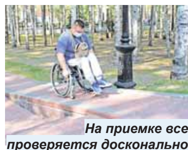
На приемке все проверяется досконально

«Если говорить о Парке Победы – все сделано достойно. И даже за