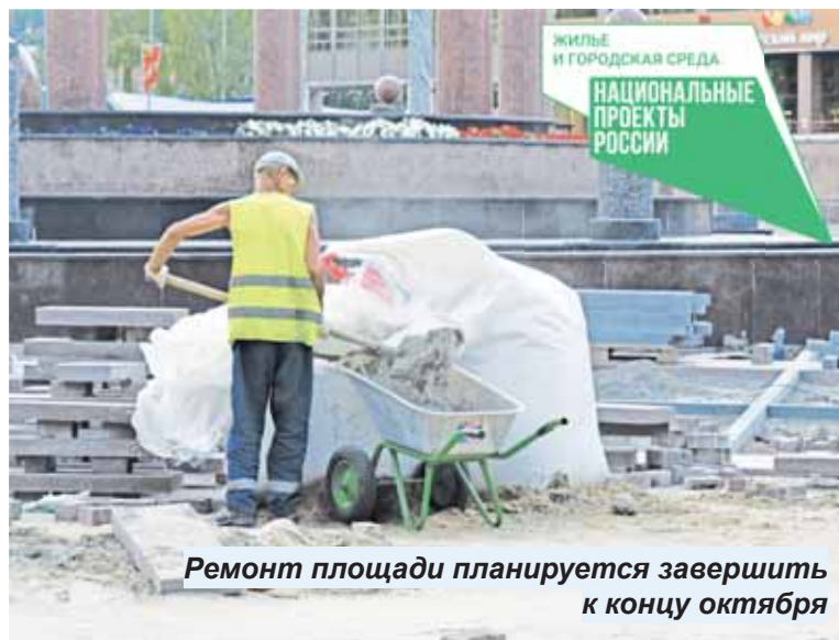
Ремонт площади планируется завершить к концу октября

– Мы собрали мнение людей, проживающих на этой улице, а также студентов и преподавателей Югорского государственного университета, в связи с чем Департамент городского хозяйства принял решение сделать здесь пешеходные дорожки, прогулочную зону и несколько парковок. Также здесь будут поставлены «умные» скамейки с Wi-Fi и USB-розетками, а также столб с видеокамерой и кнопкой SOS. Работы планируется завершить 20 августа, – рассказал Алек-