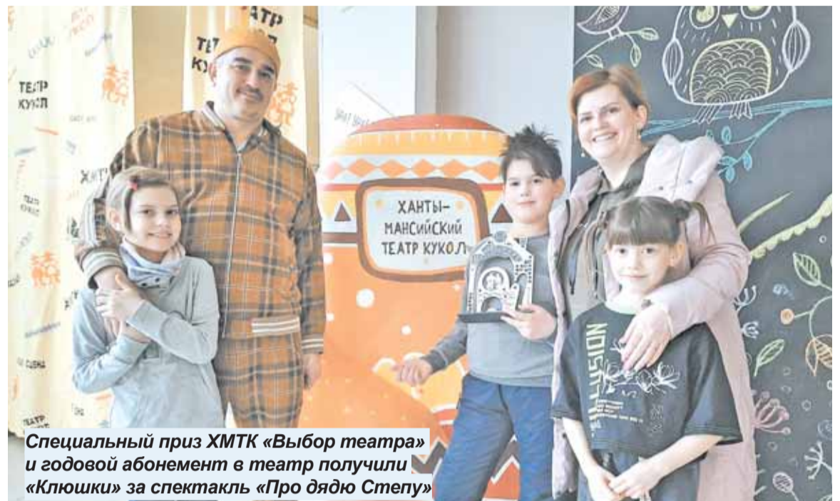
Специальный приз ХМТК «Выбор театра» и годовой абонемент в театр получили «Клюшки» за спектакль «Про дядю Степу»

- В окружном центре в онлайн-формате прошел финал IV Фестиваля семейных кукольных спектаклей «Варежка», - сообщает Ханты-Мансийский театр кукол.