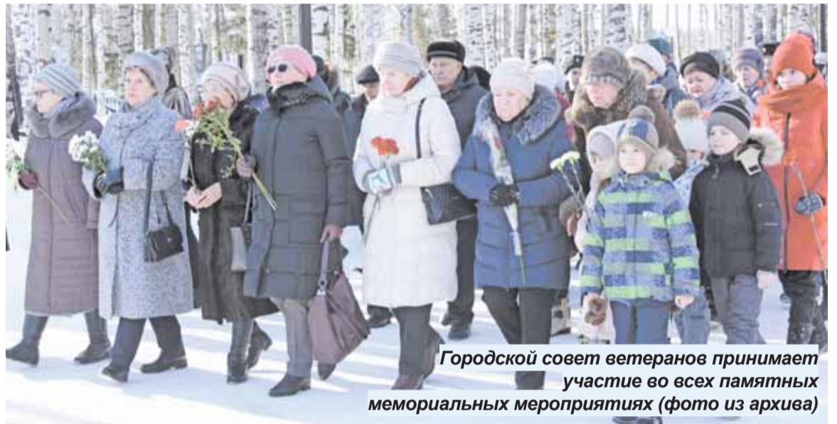
Городской совет ветеранов принимает участие во всех памятных мемориальных мероприятиях

За 55 лет собран богатый материал о хантымансийцах - участниках Великой Отече-