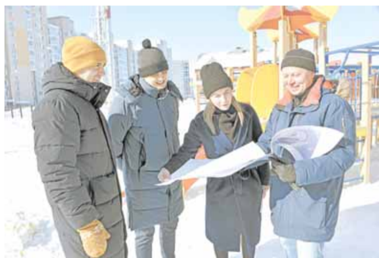
«Severin парк» в микрорайоне «Югорская звезда» планируется расширить и дополнить новыми арт-объектами

Также было отмечено, что в прошлом году в городе инициативной комиссией одобрены 12 проектов, три из которых реализованы: «Двор нашего детства» - благоустройство придомовой территории и реконструкция игровой площадки по ул. Дзержинского, 30; «Детский игровой центр «Морошка» - обустройство игровой площадки во дворе по ул. Чехова, 19 и «Многофункциональная воркаут-площад-