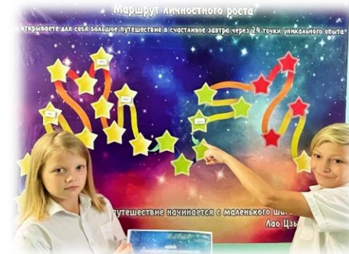
Технология выстраивания позитивного образа будущего «Дневник позитивных изменений и уникальных побед»