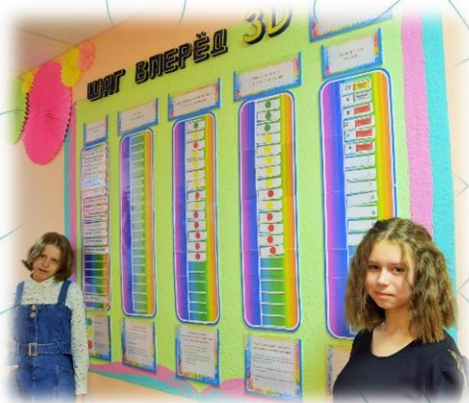
Трансформационная квест-технология «Шаг ВПЕРЕД.3D»